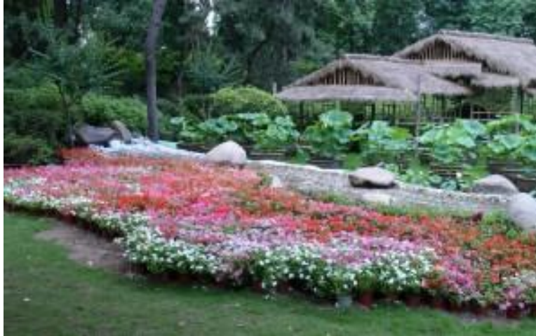
باغ چینی متلاثر از باغ ایرانی است

مهمترین نمونه تاثیر باغ های ایرانی در شبه قاره هند را در کاخ تاج محل که در دوران گورکانیان مغول (۱۷۰۷-۱۵۲۶) ساخته شد می توان یافت.