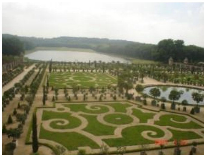
باغ های کاخ ورسای در فرانسه

باغ های کوروش تاثیر عمیقی در خارج از مرزهای ایران و به ویژه در اروپا داشتند. یونانیان پس از لشکرکشی اسکندر کبیر به ایران و احتمالاً دوران سلوکیان از باغ های ایرانی اقتباس کردند. کلمه پارسی "پردیس" به فرهنگ لغات رومیان وارد شد و از آنجا به سایر زبان های اروپایی راه یافت. یونانیان، رومیان و تمدن های اروپایی پس از آن ها پارک ها و باغ هایی با الگوی باغ ایرانی ساختند. باغ های خیره کننده ورسای در فرانسه ، باغ های عجیب کاخ بلودر اتریش و باغ های بوتچارت ویکتوریای کانادا ممکن است هرگز وجود نمی داشتند اگر باغ های کوروش در پاسارگاد نبودند. حتی کتاب مقدس یهودیان نیز کلمه "پارادایز" (بهشت) را از واژه پارسی "پردیس" اقتباس کرده است.