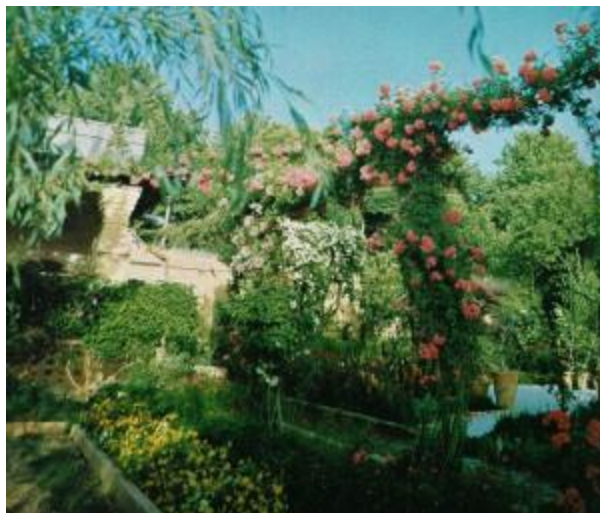
باغی در تهران سال ۱۹۷۱

شهر های کوچک و روستاهای زیادی در ایران امروزی وجود دارند که باغ هایی در خود دارند که از باغ های دوران هخامنشیان الهام گرفته اند.