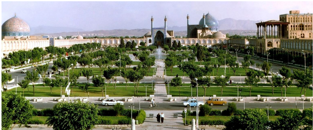
میدان نقش جهان در اصفهان از دوران صفوی

به طور قطع باغ ایرانی در دوران ایران پس از اسلام به حیات خود ادامه داد. طراحی عمارت کلاه فرنگی شاه عباس بزرگ (سلطنت: ۱۶۲۹-۱۵۸۸ میلادی) پادشاه دودمان صفوی (۱۷۳۶-۱۵۰۳ میلادی) بر اساس همین باغ است.