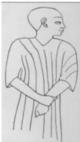
تصویر ۷. تصویر نقاشی نقش پارسی ممفیس (Hinze, 1979, 208)

نظر هنر شناسان یکی از سنت های شناخته شده ایرانی ها بوده است. احتمالاً این لباس نیز منشاء ایرانی داشته است. (تصویر ۷) (همان منبع)