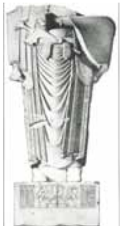
تصویر ۱۱. مجسمه داریوش موزه ملی ۱۳۸۰

ایران در دوره هخامنشیان ثبت شده است. به دستورداریوش این مجسمه از سنگ خاکستری تیره و در مصر تهیه شده سپس به ایران انتقال یافته است. [همان]