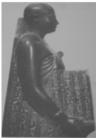
تصویر ۹. تصویر مجسمه اوجا هورسنت با سرمرمت شده (Hinze, 1976, 173.)

لقب ها و عنوان های خود در زمان چهار فرمانفرمای مصری و هخامنشی آماسیس، پسمامتیک، کمبوجیه و داریوش خود را بسیار نزدیک به آنها خوانده و می گوید: نزد تمام اربابان خود محترم بوده، و آنها او را با زیورهای زرین می آراسته اند. او از کمبوجیه بنام پدید آورنده نظم یاد کرده و او را مانند شاهان پیشین منزله از هر گونه خشونت و زیاده روی و نگهبان آیین ها و سنت های دینی و وارث همه فضیلت های باستانی معرفی می کند [رجبی، ۱۳۸۰: ۱۹۱]. بنابراین تصویر کمبوجیه در منابع یونانی بخصوص در کتاب هردوت تصویر مهاجم بیگانه سنگدلی است که علاقه یا حساسیتی نسبت به عقاید اجتماعی و مذهبی مصریان ندارد. قابل قبول علمای تاریخ و باستان شناسان نیست و همان طور که بیان شد متون مصری مربوط به آن روزگار نیز این تصویر را تأیید نمی کنند. چنانچه رویداد فتح مصر توسط کمبوجیه را اودجهورسنت در کتیبه ای در تندیس خود در واتیکان چنین شرح می دهد: (کمبوجیه شاه بزرگ همه سرزمین های بیگانه به مصر آمد و او بر تمام سرزمین مصر چیره شد. او فرمانروای بزرگ مصر شد و سمت ریاست پزشکان را به من سپرد. او مرا در کنار خود به عنوان دوست و مدیر کاخ قرار داد. من باعث شدم که شاه اهمیت سائزس مرکز سلسله سائزس را به رسمیت بشناسد، و این جایگاه نایت بزرگ است مادری که رع را زایید. من باعث شدم شاه اهمیت و بزرگی معبد نایت را به رسمیت بشناسد. شاه مصر علیا وسفلی به سائزس آمد و رهسپار معبد نایت شد و همانند هر شاهی که قبلاً چنین کرده بود زمین را لمس کرد (تصاویر ۸ و ۹) [کورت، ۱۳۷۹: ۵۰].