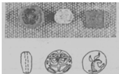
تصویر ۱۴. تصویر مهره سوسکی شکل هخامنشی کشف شده از تپه سگز آباد. ملک شه میرزادی ۱۳۷۸

یکی دیگر از یافته های باستان شناسی مصری در ایران عبارت است از مهرهای سوسکی به دست آمده از دشت قزوين که نشانگر تأثیر هنری مصری در ایران و استفاده از این نوع مهره ها در دوره هخامنشیان می باشد. قدیمی ترین اثر حضور هخامنشیان در تپه سگزآباد یک مهر سوسکی شکل از جنس بدل چینی بوده، که از طبقه ۱۲ استقرار این تپه به دست آمده است. به نظر مؤلف مقاله از هیچ یک از کاوش های انجام شده چنین موردی گزارش نشده است. مهرهای سوسکی شکل ابتدا در مصر باستان مورد استفاده قرار می گرفت و سپس به مناطق مجاور تحت نفوذ فرهنگی مصر از جمله سواحل شرقی دریای مدیترانه و سوریه و همچنین آناتولی و یونان وارد شده است [ملک شه میرزادی، ۱۳۷۸: ۷۳]. (تصاویر ۱۳ و ۱۴)