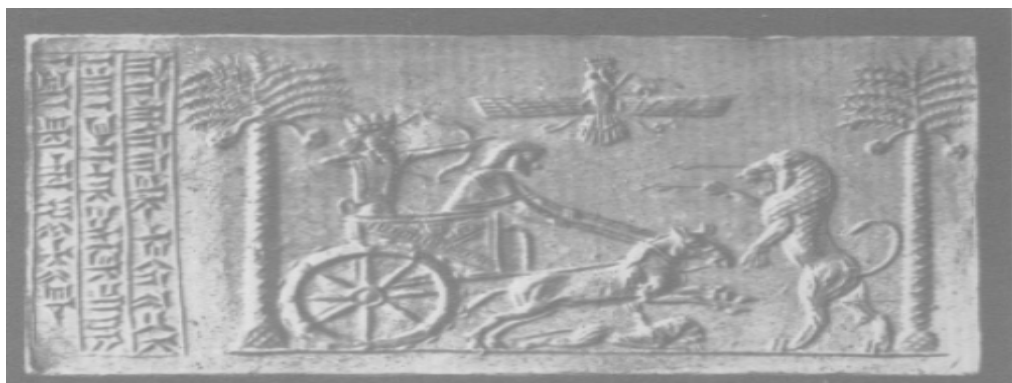
تصویر ۵. تصویر مهر داریوش در ساتراپی مصر از موزه لندن (Hinze, 1976, 176)

یکی از مهم ترین آثار دوران فرمانروائی پارس ها در مصر، مهرهای پادشاهی است که در اکثر ساتراپ ها و کشورهای ملل تابعه امپراطوری هخامنشی این مهر پادشاه بزرگ رایج بوده در واقع نه تنها چنین مهرهای منحصر بفردی وجود داشته بلکه بیش از ۳۰ عدد مهر در اختیار بوده است. چنانچه در زمان داریوش تمام مقامات عالیرتبه، از جمله کلیه استانداران که جزو مقامات عالیرتبه محسوب می شدند، یک چنین مهری را با نام داریوش داشته اند [Hinze, 1976, 175]. یک نمونه از مهر دوران فرمانروائی پارس ها در مصر از مهر داریوش که فقط یک نمونه منحصر بفرد بوده است. احتمالاً داریوش اول در سال ۴۸۷ قبل از میلاد در مصر آن را به استانداران تازه منصوب شده اعطاء کرده بود. دومین نمونه از مهرهای دوران فرمانروائی پارس ها در مصر به صورت یک مهر غلطان یا استوانه ای و تو خالی است. بر روی تصویر سطح مهر یکی از پادشاهان هخامنشی که با یک نیزه ای در دست دارد ایستاده، کنده کاری شده است. در جلوی او فرعون مصر نیز زانو زده است (تصویر ۵) [Seipel, 1996, 395].