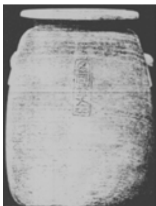
تصویر ۴. تصویر ظرف کتیبه دارپا رسی از مصر - برلین (Burchardt, 1911, 70)

براساس نظر اشمیت (R. Schmitt) بر روی یک ظرف مرمیری کتیبه دار چنین حکاکی شده است: (از پادشاهان هخامنشی داریوش اول، خشایار اول، اردشیر اول). برای جانشینان آنها نیز در دوره هخامنشیان تعداد زیادی از این ظروف کتیبه دار وجود داشته و تاکنون کشف شده است [Schmitt, 2001, 191]. برای آشنائی با نمونه های دیگر چنین ظروف کتیبه دار در حال حاضر دلیل کافی وجود دارد که به نمونه ای استناد شود که متعلق به اواخر دوران هخامنشیان در مصر بوده اند و نیز مشخصه و الگوی برای قرون بعدی بوده اند و نیز در سراسر خاور نزدیک و در عصر هخامنشیان برای همه شناخته شده بوده اند. ویژگی های ظروف مرمیری سفید یا آلاباستراها به این شکل بوده اند: این ظروف باریک و شکم برآمده ای (شکم دار) که غالباً طبق اسناد موجود از ایالات مختلف مصر به دست آمده اند و از جنس مرمیر با گردنی کوتاه، اما لبه ای پهن و دسته های کوچک و سطحی تخت و بدون پایه هستند. (تصاویر ۳ و ۴)