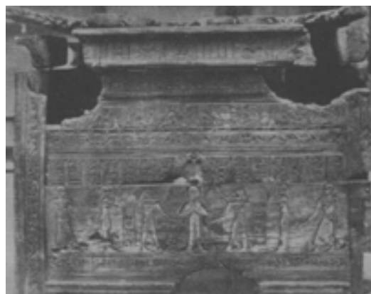
تصاویر ۲. تصویر تابوت چوبی متعلق به دوره هخامنشی در مصر (Freiherr, 1935-36, -140)