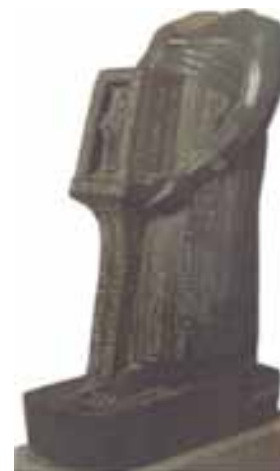
تصویر ۸. تصویر مجسمه اوجا هورسنت - واتیکا (Bresciani, 2002, 171.)