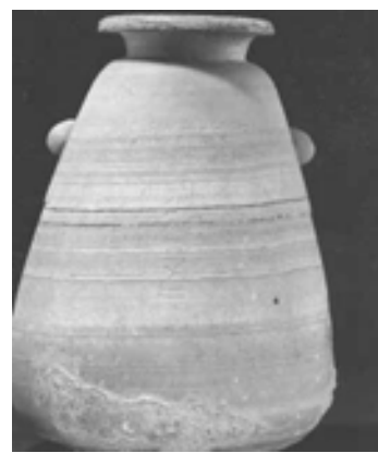
تصویر ۳. تصویر ظرف بزرگ کتیبه دار از مصر - موزه وین (Seipel, 2000, S.220)