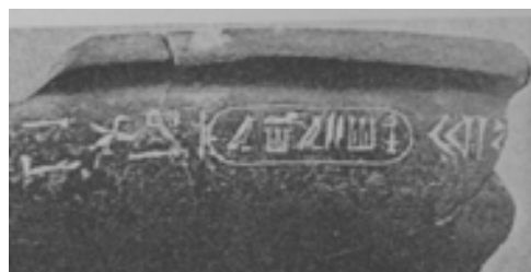
تصویر ۱۵ و ۱۶ تصویر ظرف کتیبه دار هخامنشی به دست آمده از تخت جمشید (E.F.Schmidt, 1957, S.83)