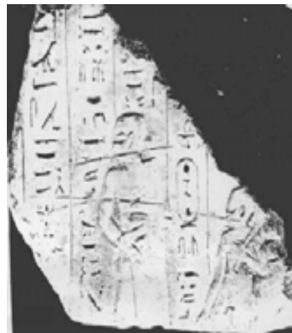
تصویر ۶ نقش برجسته پارسی ممفیس (Schulman, 1981, 103)

به نظر والتر هینس بعدها در مصر سنت های جدیدی از اقوام رخ می نماید: مثلاً یک نقش برجسته مسطح که از ممفیس به دست آمده، سه مصری را با موهای صاف و لباس های بلند با آستین های کوتاه نشان داده شده است. هر سه شکل رفتار مشابهی دارند: با دست سمت راستشان میچ دست چپشان را گرفته اند [W.Hinze 1979]. بازوی چپ فقط خیلی ساده روی ساعد کنده کاری شده، نشان دهنده این است که از یک آستین پهن تشکیل شده، آنجا حتی اثر سطحی طرح چنین چیزی که از گردن قابل تشخیص باشد، وجود دارد. با وجود این می تواند فقط سایه ساده ای بر روی تصویر باشد [Schulman 1981, 105]. که منحصرأ این رفتار به وسیله داریوش اول در سرزمین ملل تابعه معمول شده بود، چنین رفتار و اقدام و تأثیر برانگیزی بعدها در زمان نبیره او داریوش دوم (۴۰۵-۴۲۳ ق.م) با این دستور که دست ها باید در آستین ها پنهان و پوشیده شوند، جایگزین شد [Hinze, 1979, 207].