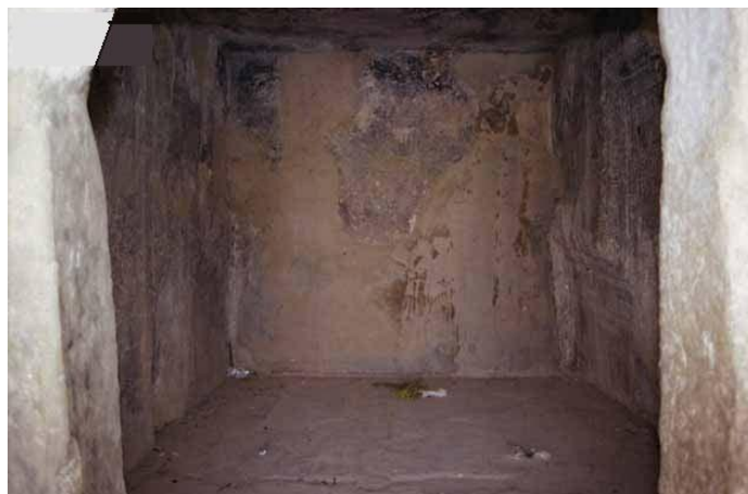
حجره داخل مقبره کوروش بزرگ در پاسارگاد

بخش جالب دوم حجره کوچکی است که برخی تأثیرات اورارتویی در آن به چشم می خورد. اورارتو در شمالغربی ایران و قفقاز - به تقریب در ارمنستان کنونی - خود پیش از آن با عناصر هنری و معماری در هم آمیخته بود، هرچند این حیظه ایست که به کاوش و پژوهش بیشتری نیاز دارد.