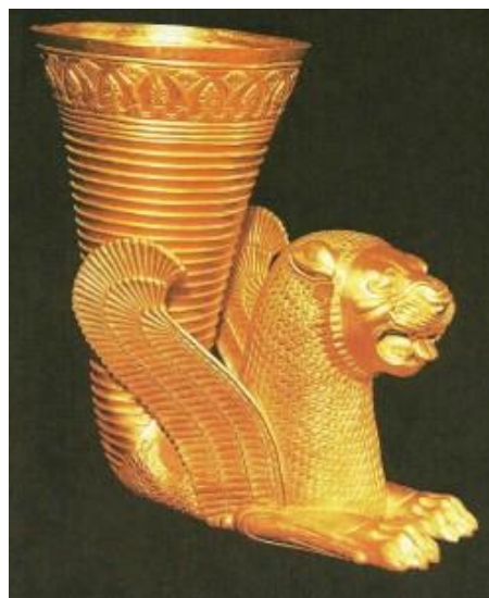
ریتون (تکوک) هخامنشی

باور بر این است که اشیائی که اسکندر در محل پیدا کرد شامل فرش (شاید نوع پازیریک)، تابوت طلایی جواهرنشان، یک تخت با پوشش (شاید نوعی لحاف) و میزی با جام هایی از نوشیدنی (شاید شبیه ریتون/تکوک تصویر پایین) بود.