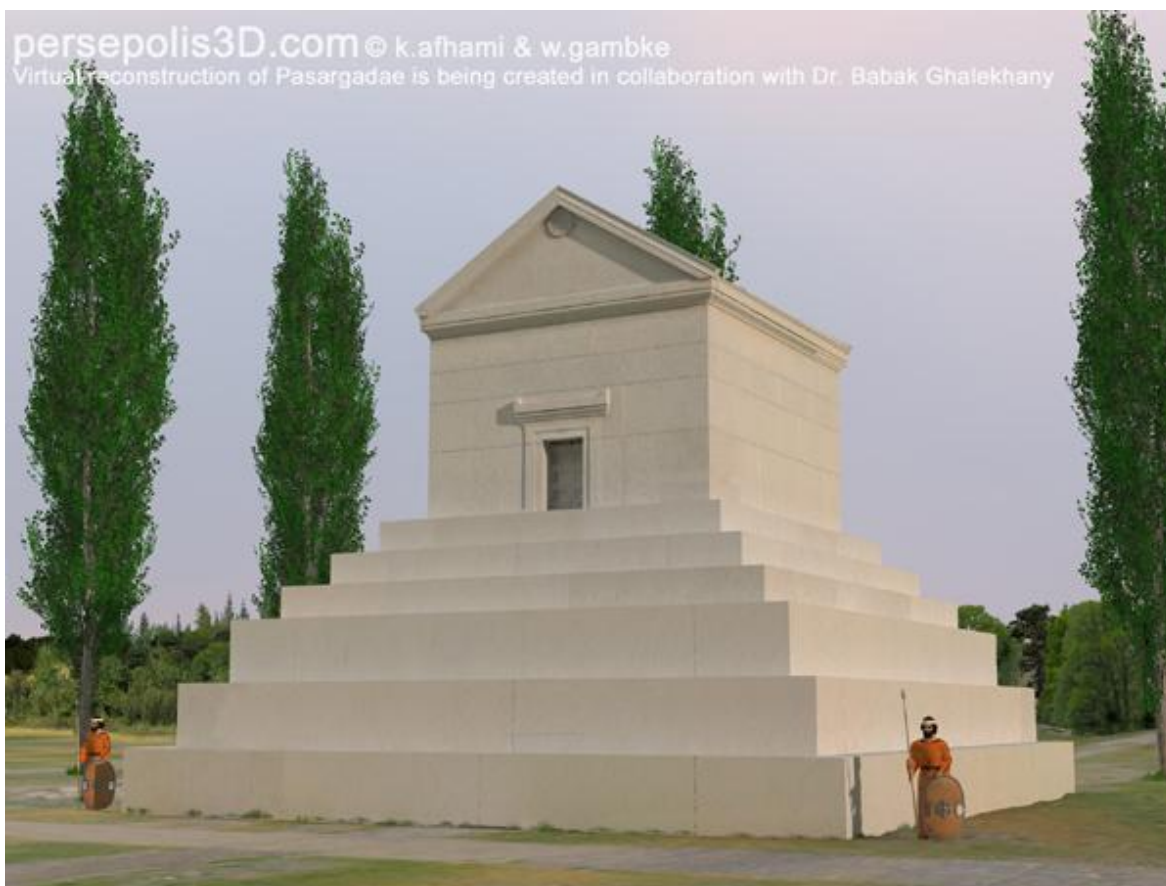
پروژه Persepolis3D: بازسازی سه بعدی مقبره کوروش