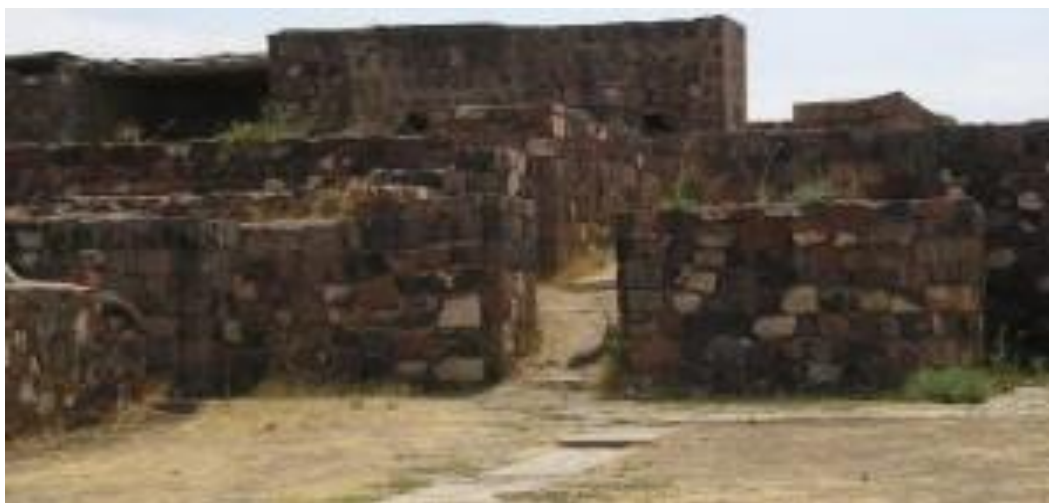
قلعه اربونی (اراتویی) در ایروان، ارمنستان امروزی

اندازه ابعاد خود مقبره به قرار زیر است: ۲,۱۱ متر بلندا، ۳,۱۷ متر درازا و ۲,۱۱ متر پهنا. پژوهشگران دریافتند که این اندازه ها مشابه ابعاد مقبره شاه الیانس دوم لیدی است. البته می توان اینطور نیز فرض کرد که مقبره های زیرزمینی لرستان که همین نوع سقف داشتند هم تاثیر گذار بودند. لرستان نقطه پیوند اولیه پیدایش و اختلاط اشکال مختلف فنون هنری، فلزکاری و ساختمان سازی گوناگونی بود و از این رهگذر تاثیر به سزایی بر فلات ایران و شمالغرب ایران گذاشت.