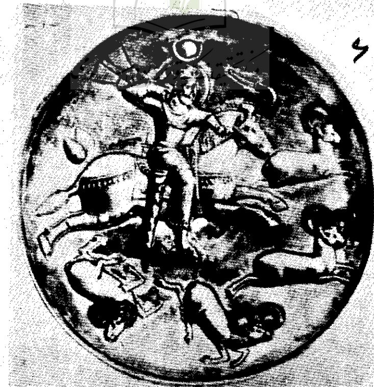
خسرو اول در حال شکار