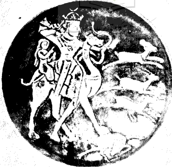
بهرام پنجم و آزاده ، مجلس شکار (موزه لنینگراد)