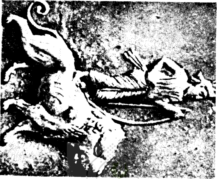
ختمسایارشا (مجموعه خصوصی)