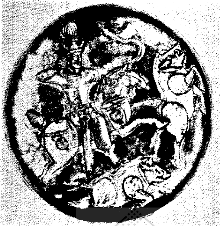
شکار گراز شماپور دوم (موزه کالری امریکا)