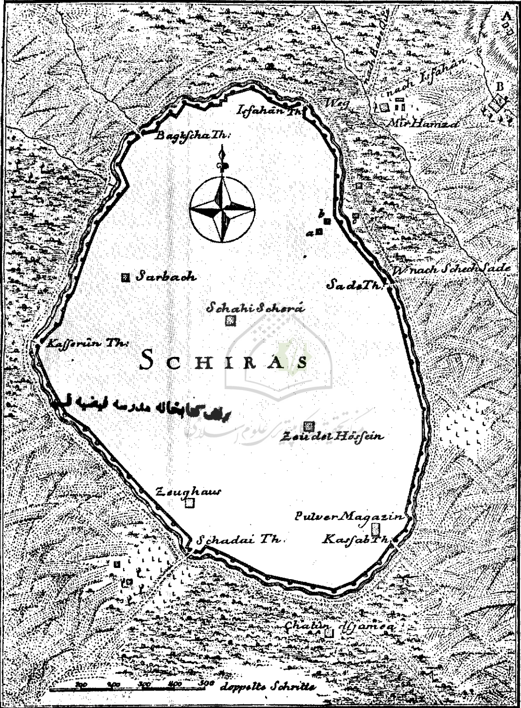
شكل ١ - نقشه ترسيمی نيپور که سر باغ (Sarbach) را نشان ميدهد