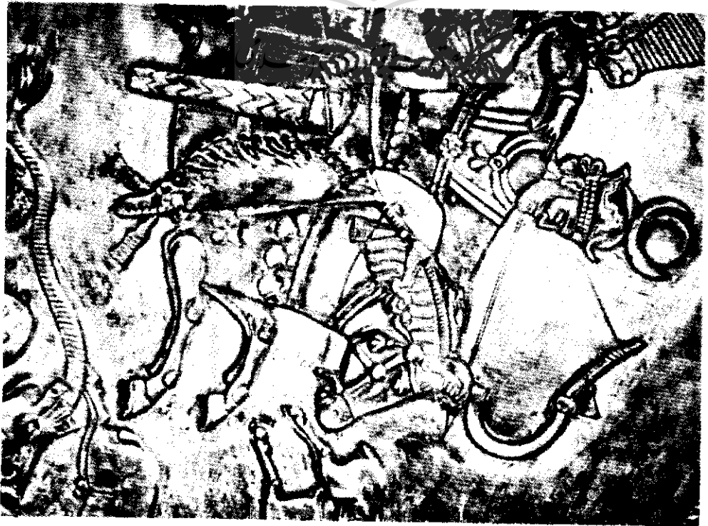
پیروز شاهنشاه ساسانی در حال شکار