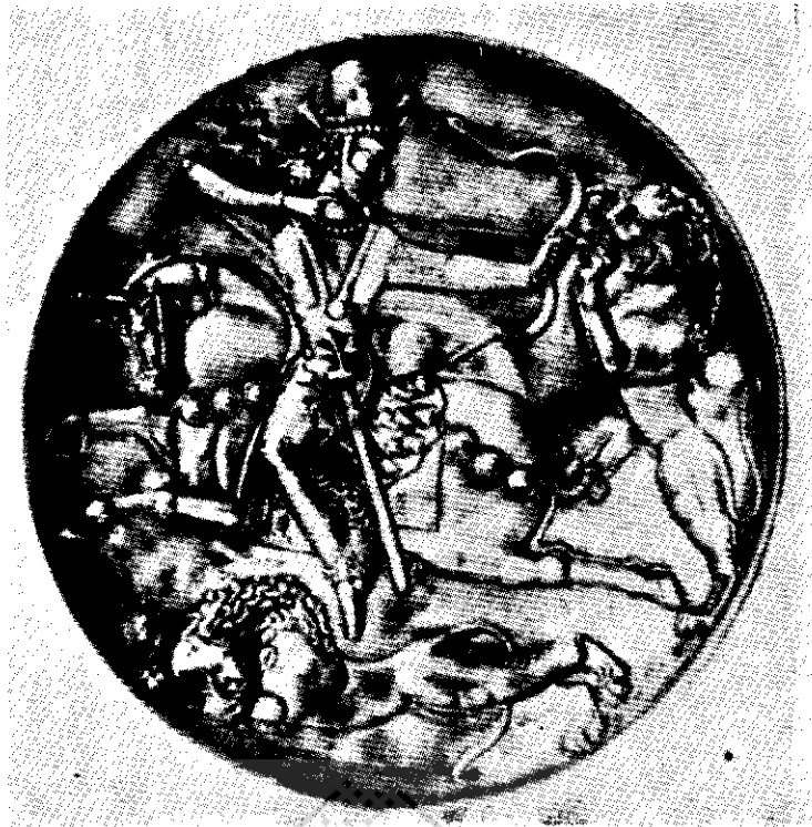
شکار شیر شاپور دوم (موزه لنینگراد)